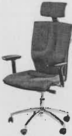
Fotel: zdjęcie poglądowe

Dla części 1 i 2 dostawa do siedziby Zamawiającego (Szczecin, ul. Mickiewicza 41), montaż, a następnie ustawienie w pomieszczeniach biurowych na parterze według wytycznych Zamawiającego jak również posprzątanie po pracach montażowych i utylizację materiałów/śmieci po wykonanych pracach montażowych.