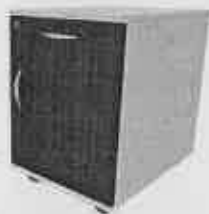
Kontenerek – zdjęcie poglądowe

2) kontenerki 6 szt do w/w biurek. Podstawowa charakterystyka: wielkość/ wysokość kontenerów musi być dostosowana do wspólnego użytkowania w w/w biurkami, tzn.: muszą mieścić się pod nimi. Kolor tożsamy z biurkami. Muszą posiadać kółka oraz 1 szufladę oraz 1 półkę, wkład szuflady zamykany zamkiem centralnym, 2 klucze łamane