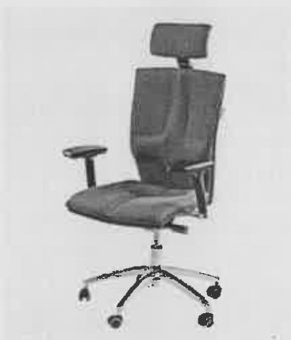
Fotel: zdjęcie poglądowe

Dane użytkownika fotela : kobieta, wzrost: 165 cm, waga: 59 kg