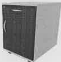
Kontenerek – zdjęcie poglądowe