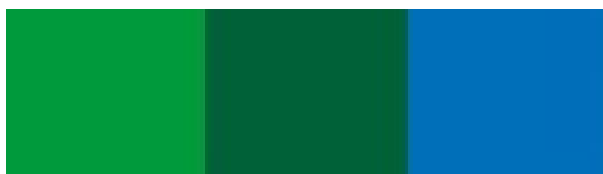
Poglądowe kolory podstawy

Ilość: 300 szt., po 100 szt. każdego koloru.