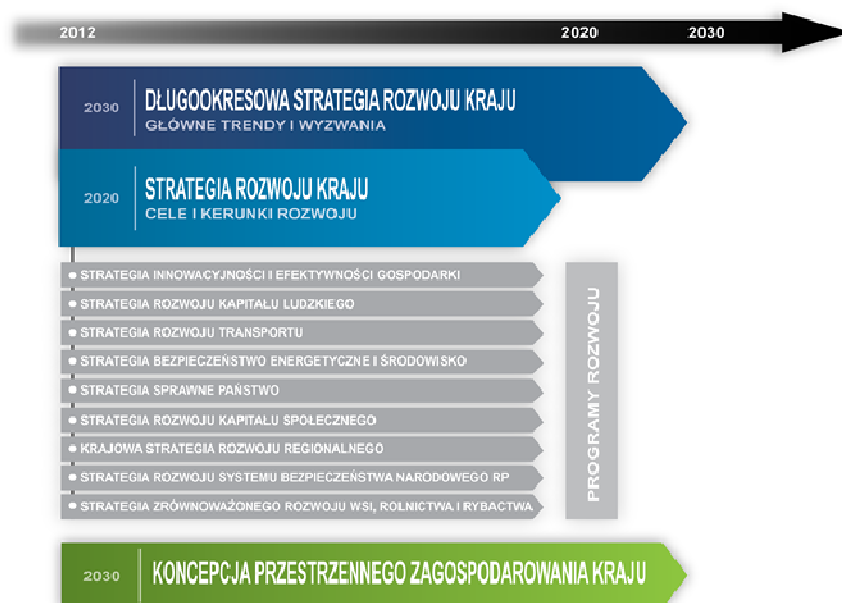
Schemat 1: System krajowych dokumentów strategicznych.

Ramy przestrzenne dla prowadzenia polityki rozwoju w Polsce, w tym realizacji poszczególnych strategii rozwojowych stanowi KPZK, przyjęta przez Radę Ministrów 13 grudnia 2011 r. Jest to główny dokument strategiczny kreujący ład przestrzenny w Polsce oraz porządkujący zagadnienia związane z rozwojem, w którym przestrzeń traktowana jest jako płaszczyzna odniesienia dla działań rozwojowych. Powiązania pomiędzy krajowymi dokumentami strategicznymi pokazuje poniższy schemat.