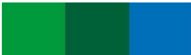
Poglądowe kolory podstawy

Ilość: 210 szt., po 70 szt. każdego koloru.