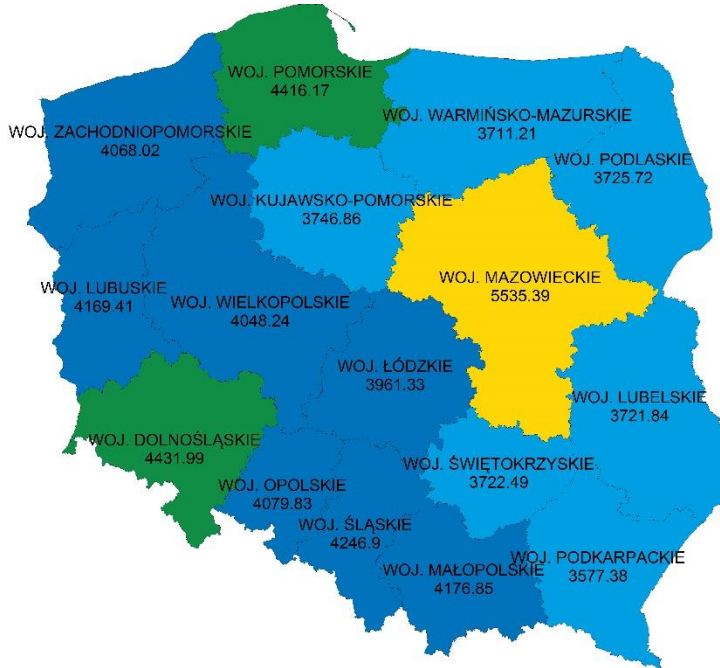
Przeciętne wynagrodzenia brutto według stażu pracy

Przeciętne godzinowe wynagrodzenie ogółem brutto wyniosło 24,65 zł